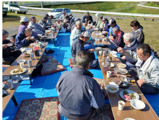
左の写真：草刈り作業後の直会の様子(令和元年度)

集落内を大平川、南小梨川が流れ、小梨地区では最も多い133戸364人が暮らす。総務部、体育厚生部、教育文化部、青年部、女性部、産業部で構成。