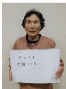
A. みんなを笑顔にする