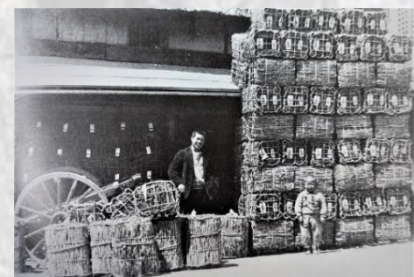
昭和初期の某製炭店。炭俵が山積み! 『写真記録集 一関の年輪(1900)』より