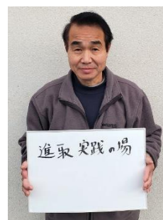
A. 進取 実践の場